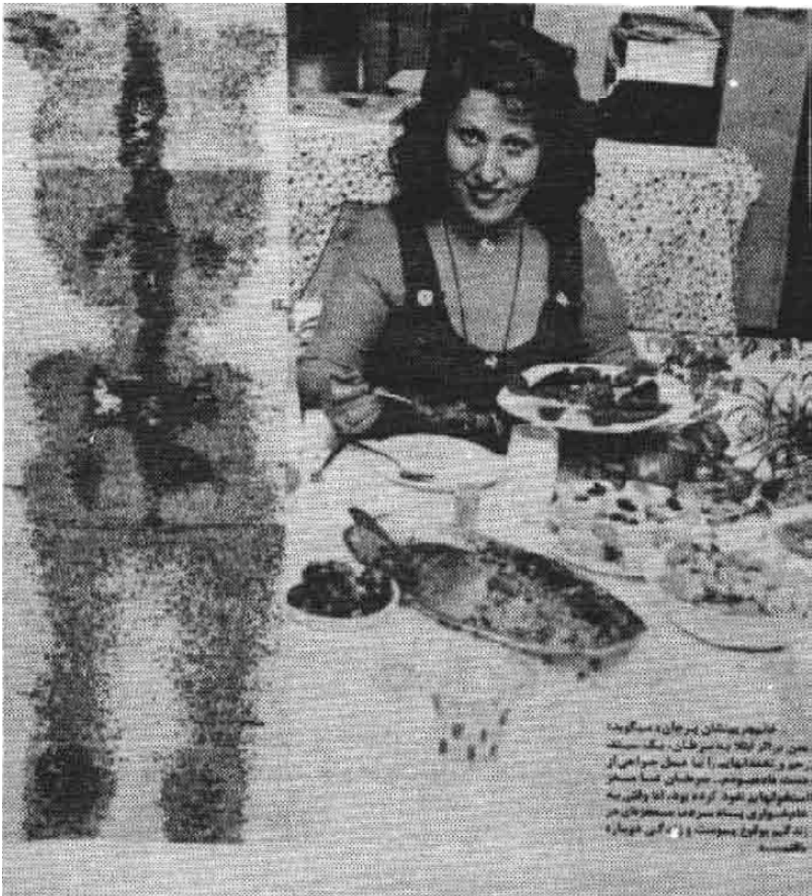
خانم‌ها در جشن پر جان و سنگین همین در آن ایام بدستشان، یک سینه بزرگ و خوشمزه را با سبزیجات از دستگاه ماهیگیری، در میان آنها میسر است. آنها را به خود کرده بود، اما وقتی به عاشقانه‌های پستان سر آمد، دستشان در زاد گریه بود. دوست و زانی خندان و خوشبخت.