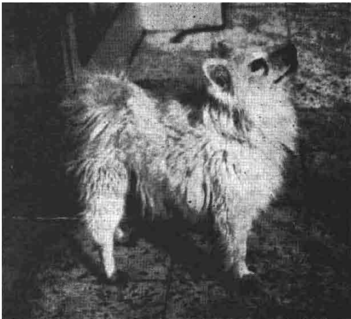
سگ هفت ساله به نام «جکی» که در تمام عمرش فقط با غذای زنده نباتی تغذیه نموده است. به صفحه ۱۳ رجوع کنید.