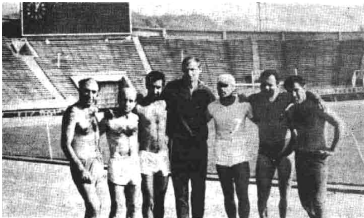
ورزشکارانی که با دویدن خود در ارمنستان شوروی به شهرت بزرگی رسیده‌اند.

روزنامه «آوانگارد» نوشته بود را با هیجان زیاد برای ما خواند. همگی با کف زدن بلند شدیم و به سلامتی شما آبمیوه نوشیدیم. در حقیقت ما با وجود شما سربلند و خوشبخت بودیم.